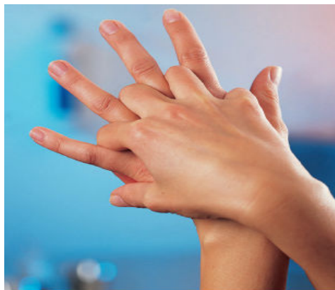
۲- با کف دست راست پشت دست چپ را مالش دهید و برعکس.